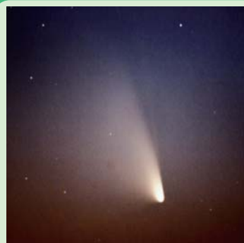
パンスタース彗星