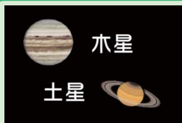
AstroArts ステラナビゲータ8にて作成