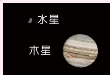
AstroArts ステラナビゲータ8にて作成