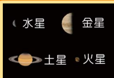
AstroArts ステラナビゲータ8にて作成

水星は中旬の昼間から、金星は下旬までの昼間、火星初旬までの夕方に、土星は暗くなり次第見ることができます。