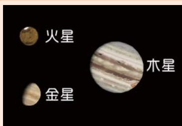
AstroArts ステラナビゲータ8にて作成