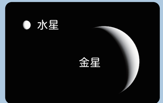
AstroArts ステラナビゲータ 10 にて作成