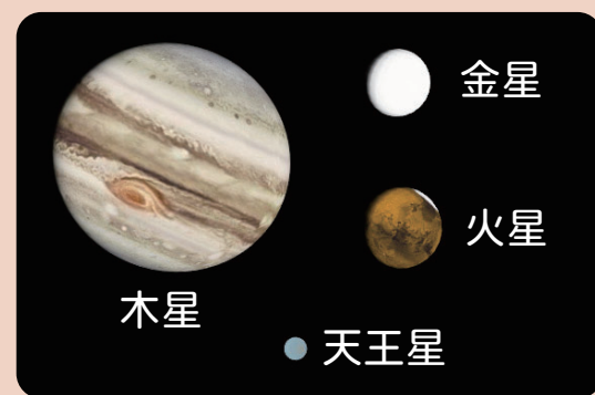
AstroArts ステラナビゲータ 10 にて作成