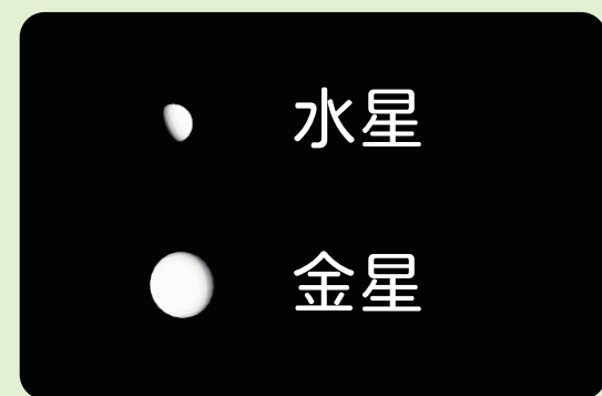
AstroArts ステラナビゲータ 10 にて作成