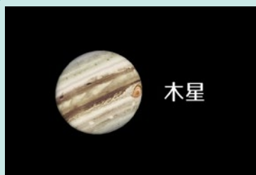
AstroArts ステラナビゲータ 1.0にて作成