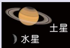
AstroArts ステラナビゲータ8にて作成