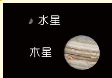
AstroArts ステラナビゲータ8にて作成