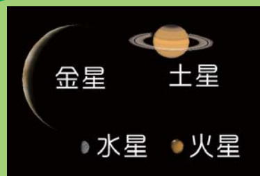
AstroArts ステラナビゲータ8にて作成