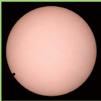
金星の太陽面通過(2004年)

6月6日は太陽の前を金星が横切り太陽面にポッカリと虫食い穴の様な金星が見られる「金星の太陽面通過」があります。前回、2004年に起きたこの現象は次回見られるのは105年後の2117年となるととても珍しいものです。望遠鏡がなくても日食グラスがあると見ることが出来る現象ですのでぜひご覧ください。