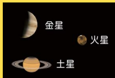
AstroArts ステラナビゲータ8にて作成