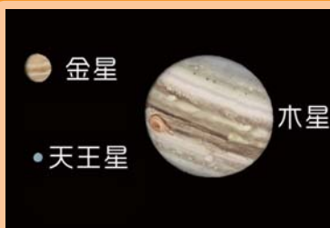
AstroArts ステラナビゲータ8にて作成