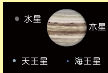
AstroArts ステラナビゲータ8にて作成

水星は上旬の昼間に、木星は中旬頃の夜から、天王星と海王星は上旬頃の夜から見え始めます。