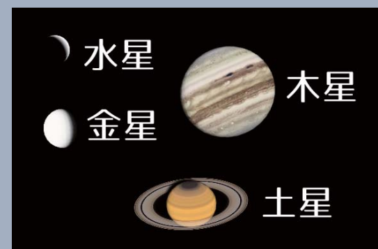
AstroArts ステラナビゲータ 10 にて作成

水星(中旬まで)と金星は昼間に、木星(上旬まで)、土星は夜に見ることができます。