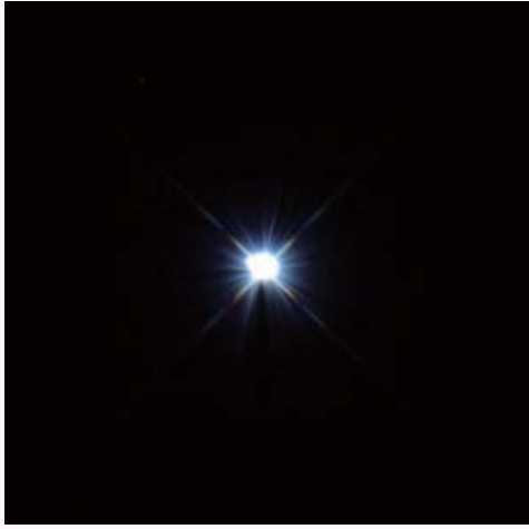
おとめ座の1等星スピカ

スピカは「おとめ座」にある1等星です。表面温度が約2万度もあります。その青白い輝きから「真珠星」とも呼ばれています。距離は地球から250光年離れています。