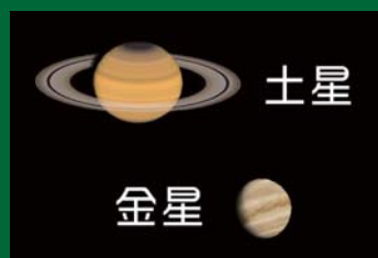
AstroArts ステラナビゲータ8にて作成