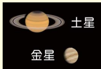
AstroArts ステラナビゲータ8にて作成