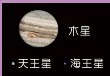
AstroArts ステラナビゲータ8にて作成