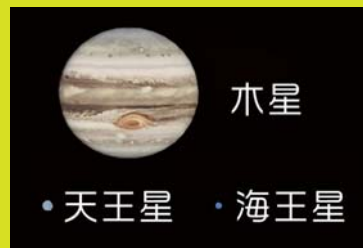
木星 天王星 海王星