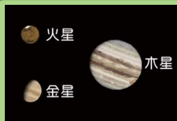
AstroArts ステラナビゲータ8にて作成

金星は昼間から夜の早い時間まで、木星は夕方から、火星は2月下旬頃より見られます。