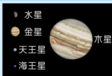
AstroArts ステラナビゲータ8にて作成

金星と水星は昼間に、(水星は中旬頃まで)木星、天王星、海王星は夜に見ることができます。