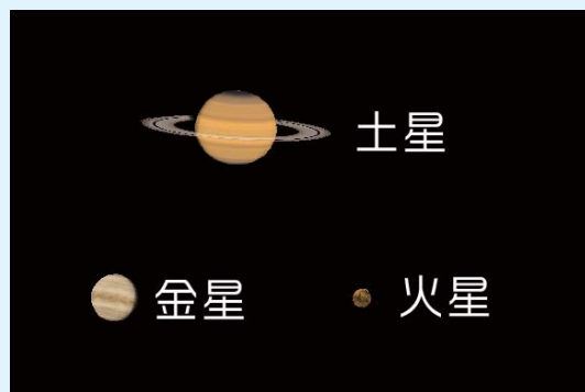
AstroArts ステラナビゲータ8にて作成