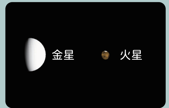
AstroArts ステラナビゲータ 10 にて作成