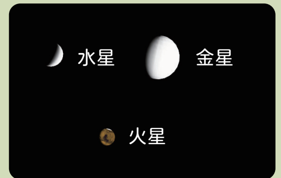
AstroArts ステラナビゲータ 10 にて作成

水星は上旬の昼間から日没頃まで、金星は昼間から夕方まで、火星は暗くなってから見られます。