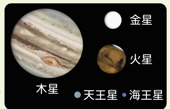
AstroArts ステラナビゲータ 10 にて作成