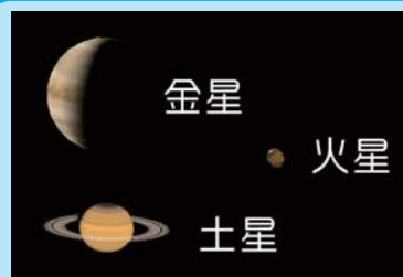
AstroArts ステラナビゲータ8にて作成