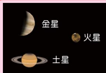
AstroArts ステラナビゲータ8にて作成