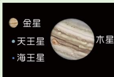
AstroArts ステラナビゲータ8にて作成