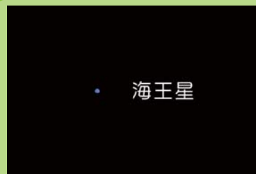
AstroArts ステラナビゲータ8にて作成

8月は惑星が殆ど見られない月ですが下旬頃から発見から太陽の周りを1周した海王星が見え始めます。