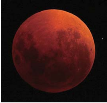
2007年8月28日の皆既月食の様子